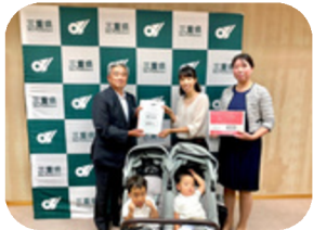
おもいやり駐車場利用期間延長署名活動（2022年）