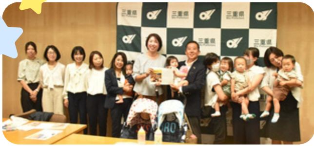
県へ多胎アンケート結果と支援要望書を提出（2023年）