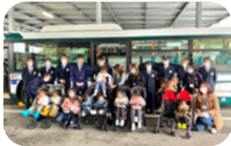
二人乗りベビーカーによるバス試乗会（2023年）

双子・三つ子の子育ては、喜びが大きい一方で不安や負担も人一倍です。妊娠期から子どもが成長するまで、単胎育児とは違う課題が次々と押し寄せ、情報や支援を探すのにも限界があり孤立してしまうことも少なくありません。