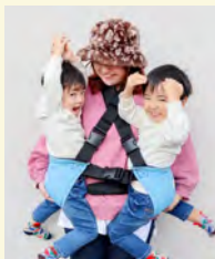
寄贈：ツインスエイド