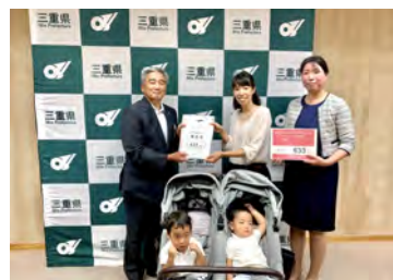
三重県副知事へ署名と要望書提出

外部の方からの子育てイベント企画の持ち込みやコラボ、見守りボランティアのお問い合わせも大歓迎です☆